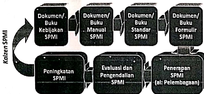
Gambar 2. Dokumen SPMI, (Sumber Permendikbud N0 50 Tahun 2014, Pasal 11 ayat (3))

Dokumen SPMI dituangkan dalam bentuk Buku yang terdiri dari ; Kebijakan SPMI PT Manual SPMI , Standar SPMI dan Formulir SPMI, secara di diagramatis disajikan pada gambar berikut :